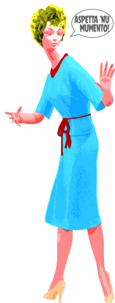
Ilustracion de Luca Serafino.