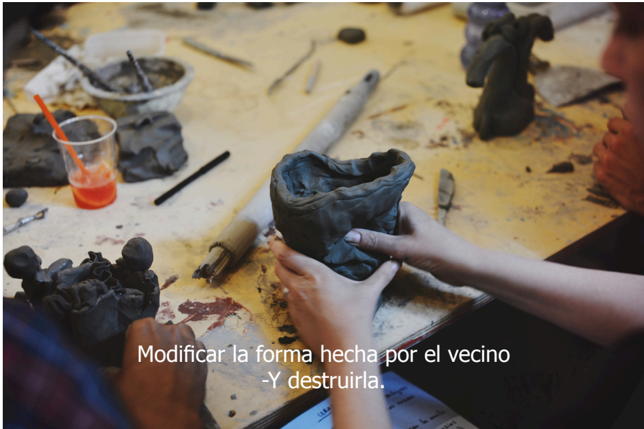
Segundo taller - Ceramica colaborativa y modular