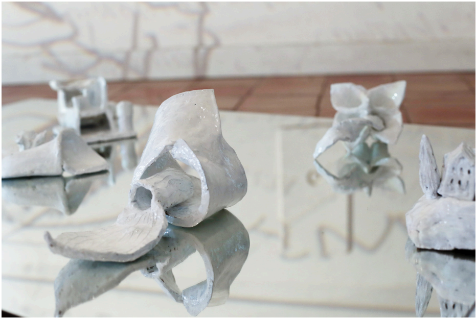
Tercero y utlimo taller - XXXXXXXX????