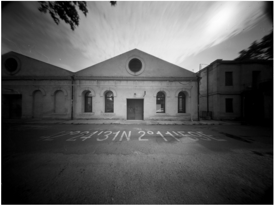
Arriba y doble pagina siguiente: fotografias de Luca Anzani.