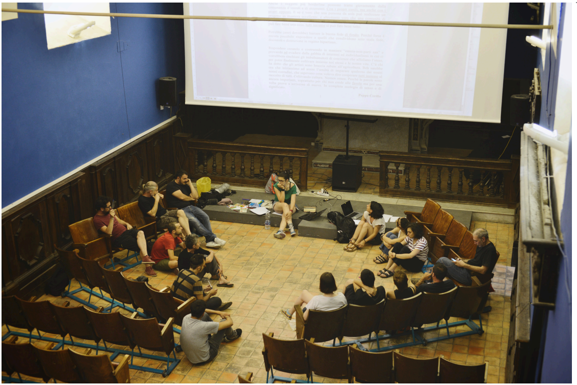
Primo taller hecho en l'asilo.

TEMPO, VALORE, CONDIVISIONE CURA → ATTENZIONE