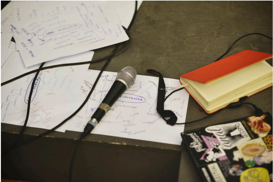
Primero taller - Produccion de artefactos visuales y orales